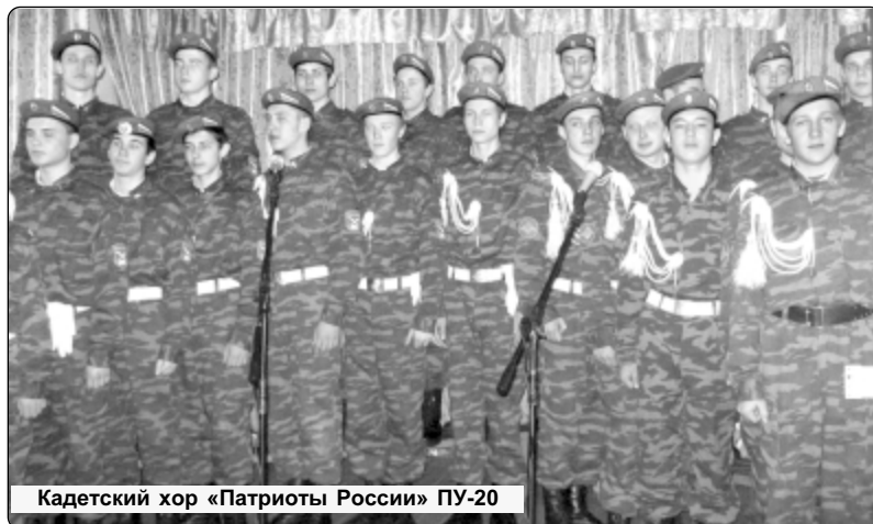
Кадетский хор «Патриоты России» ПУ-20

19 февраля в с.Шмаково прошел сельский Фестиваль гражданской патриотической песни «Родина. Честь. Слава!». Организаторами конкурса выступил СДК.