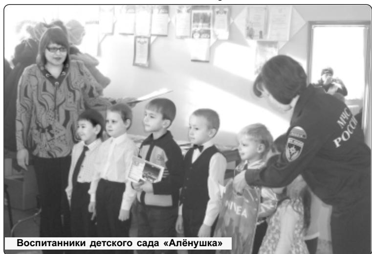
Воспитанники детского сада «Алёнушка»

16 числа в здании районного дома культуры были подведены итоги конкурса «Пожар глазами детей». Этот конкурс детского творчества на противопожарную тематику проходил в Кетовском районе с 1 ноября по 20 декабря 2009 года. В данном мероприятии приняли участие 185 ребят, среди которых были воспитанники одиннадцати средних школ, четырёх основных школ, пяти детских садов и Дома детского творчества.