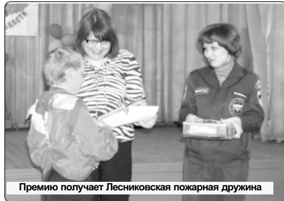
Премия получает Лесниковская пожарная дружина