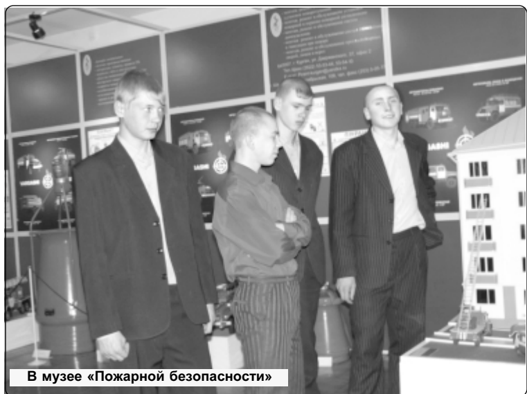
В музее «Пожарной безопасности»

В целях повышения эффективности взаимодействия межрайонной уголовно-исполнительной инспекции №2 УФСИН России по Курганской области и подразделения по делам несовершеннолетних ОВД по Кетовскому району в организации профилактической работы с несовершеннолетними, осужденными к мерам наказания, не связанным с лишением свободы, в период с 5.04.2010 года по 15.04.2010 года на территории обслуживания ОВД по Кетовскому району проведена оперативно-профилактическая операция «Условник».