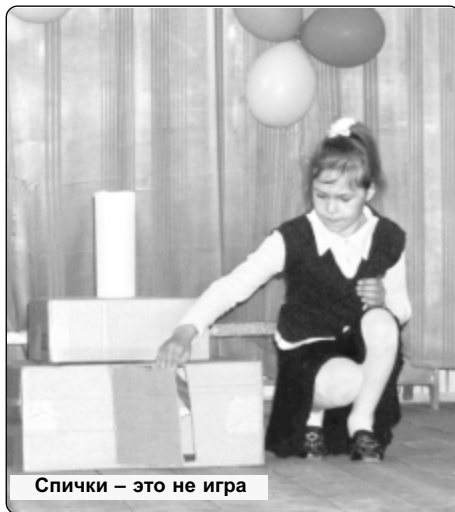
Спички – это не игра