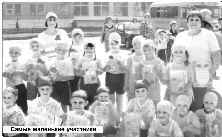
Самые маленькие участники