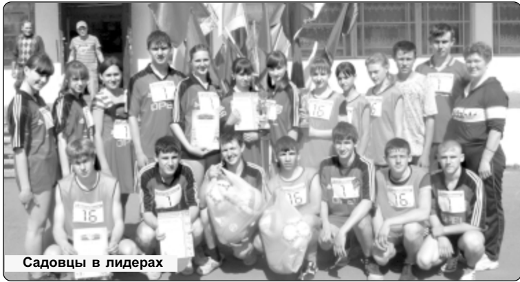
Садовцы в лидерах

Подтянутые, в спортивной форме, с эмблемами и георгиевскими ленточками самые маленькие спортсмены мерились силами впервые в легкоатлетической эстафете на приз газеты «Собеседник».