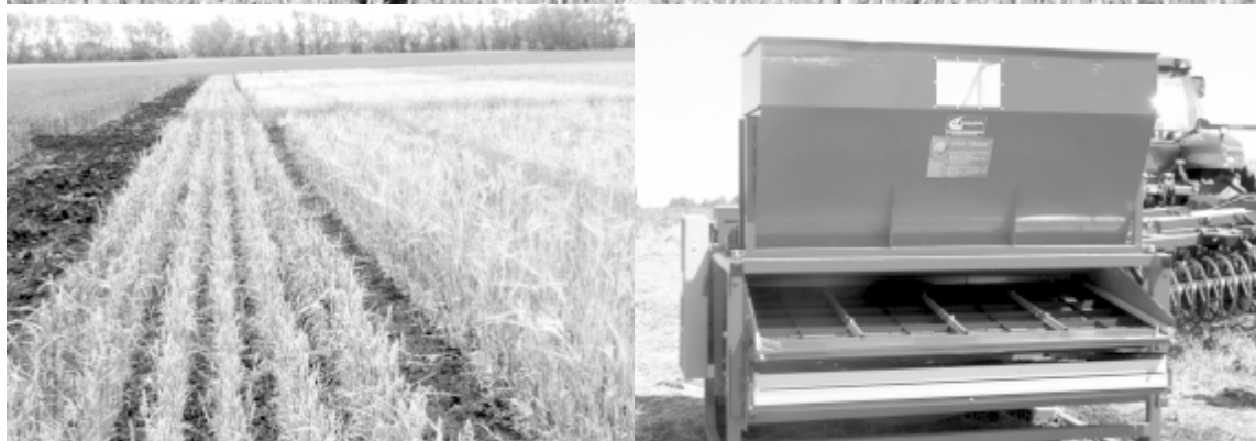
20 июля в с. Садовое прошел традиционный «День зауральского поля». Подробности читайте в следующем номере.