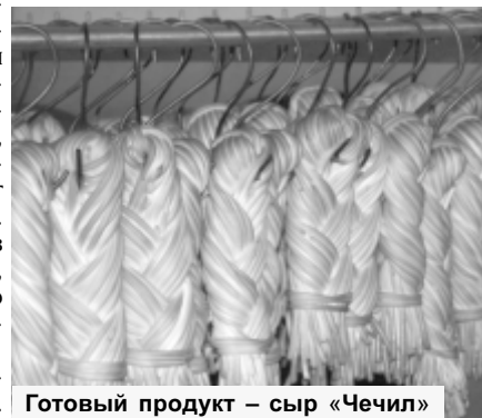
Готовый продукт – сыр «Чечил»