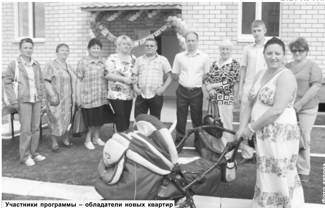
Участники программы – обладатели новых квартир