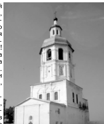
Храм преподобной Марии Египетской

Нам посчастливилось побывать в двух храмах, находящихся друг против друга: храм Святителя Николая и храм Преподобной Марии Египетской. Этот храм – двухэтажный и подниматься нужно по довольно крутой высокой лестнице. Зато ис-