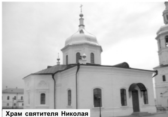
Храм святителя Николая