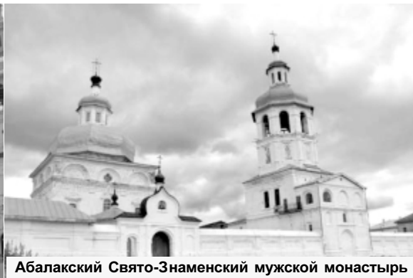
Абалакский Свято-Знаменский мужской монастырь