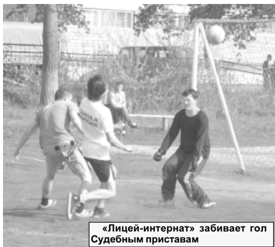
«Лицей-интернат» забивает гол Судебным приставам