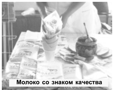
Молоко со знаком качества