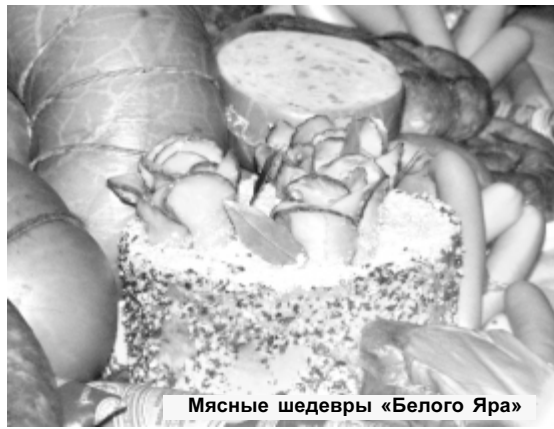
Мясные шедевры «Белого Яра»