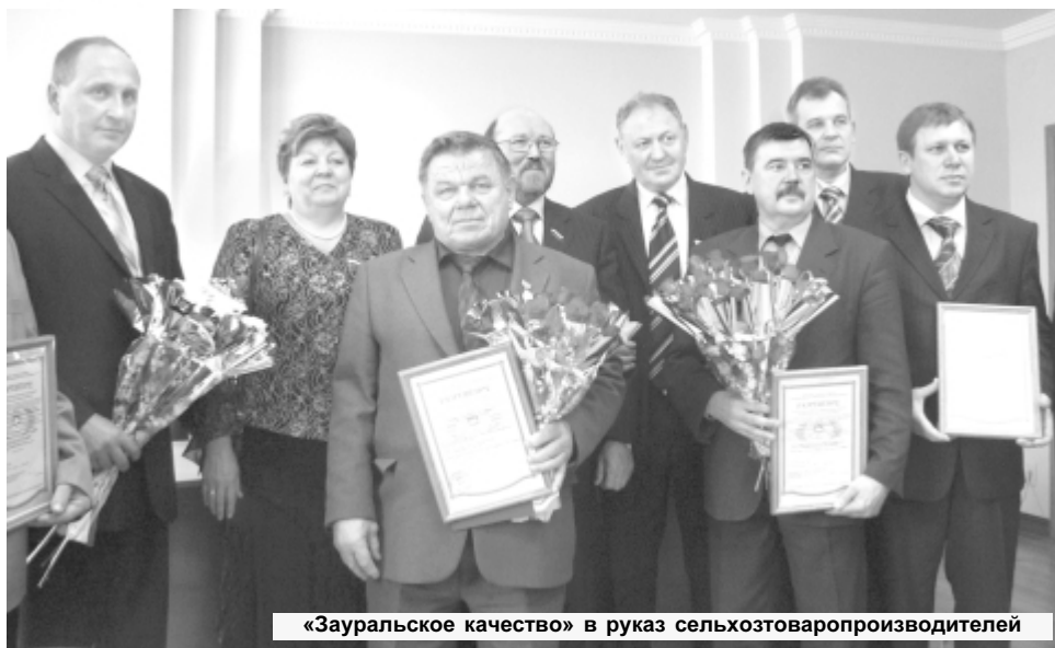
«Зауральское качество» в руках сельхозтоваропроизводителей

Проблема качества продуктов питания, реализуемых в России, приобрела особую значимость. Зачастую, серьезные заболевания стали следствием использования недоброкачественной пищи.