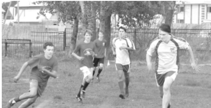
«Ступени» и Комбанк в погоне за мячом

Действительно, погода не подкачала. Ясные, солнечные денёчки придавали дополнительный импульс горячим схваткам в соревнованиях. Жаркие баталии разгорелись 22 мая на футбольном поле Кетовской средней школы, где был дан старт спортивным соревнованиям по разным видам спорта.