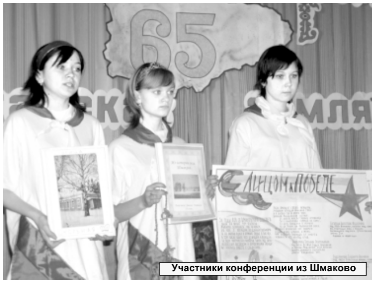
Участники конференции из Шмаково

Начало. Продолжение на стр. 3. Ирина ПОТАПОВА.