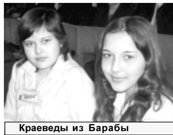
Краеведы из Барабы