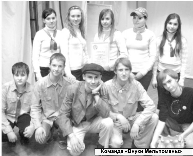
Команда «Внуки Мельпомены»

Учредители чемпионата: Главное управление образования Курганской области, фонд развития клубов веселых и находчивых «Фонд КВН-21 век» и админист-