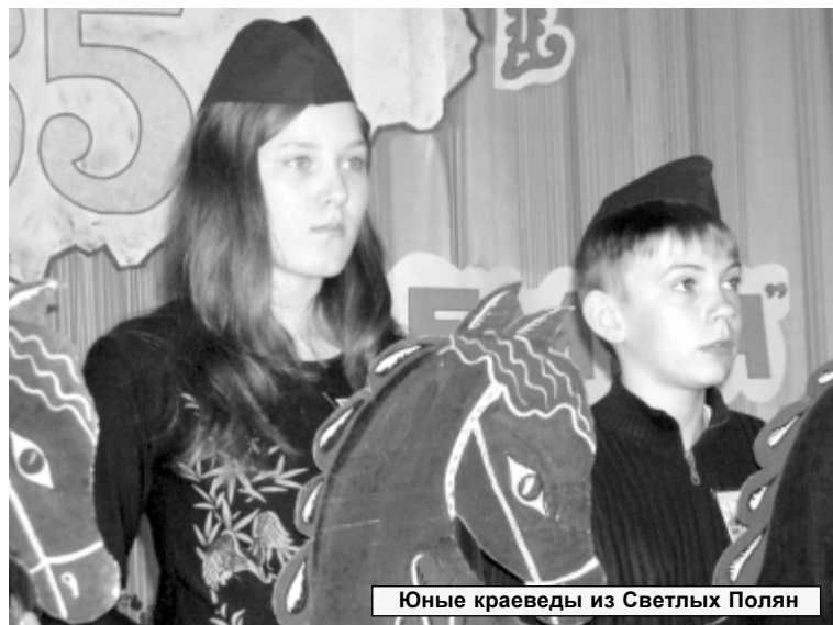
Юные краеведы из Светлых Полян

ливое высказывание: «Лучшее, что нам даёт история, — это возбуждаемый ею энтузиазм». Исследование родного края, народ-