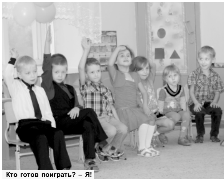
Кто готов поиграть? – Я!

Программа вечера включала в себя и игры. Интересно было наблюдать, как старшее поколение, завязав глаза, на ощупь