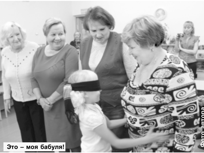
Это – моя бабуля!

определяли, где их внук или внучка. Не ошибся никто! Ответным действием стала игра «Найди свою бабушку», когда уже малыши, немного волнуясь, искали своих родных. Велика детская любовь – все ребята смогли отыскать именно свою бабушку.