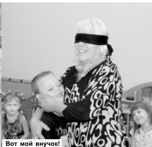
Вот мой внучок!