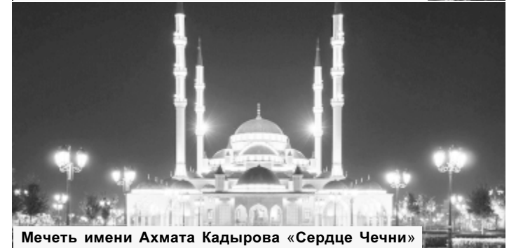
Мечеть имени Ахмата Кадырова «Сердце Чечни»