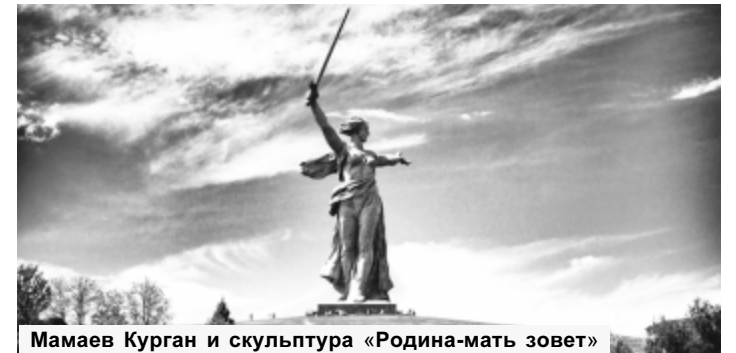
Мамаев Курган и скульптура «Родина-мать зовет»