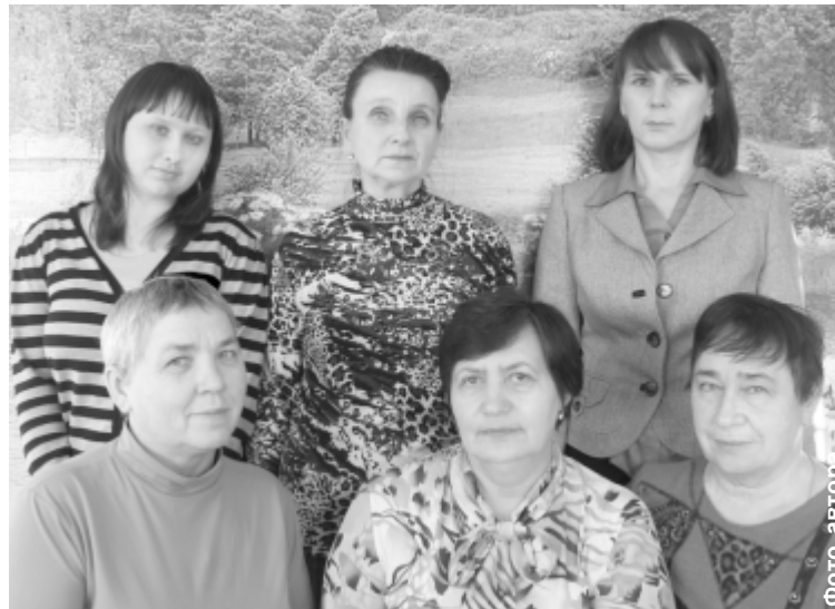
Сотрудники Кетовского отдела «Россельхозцентра»