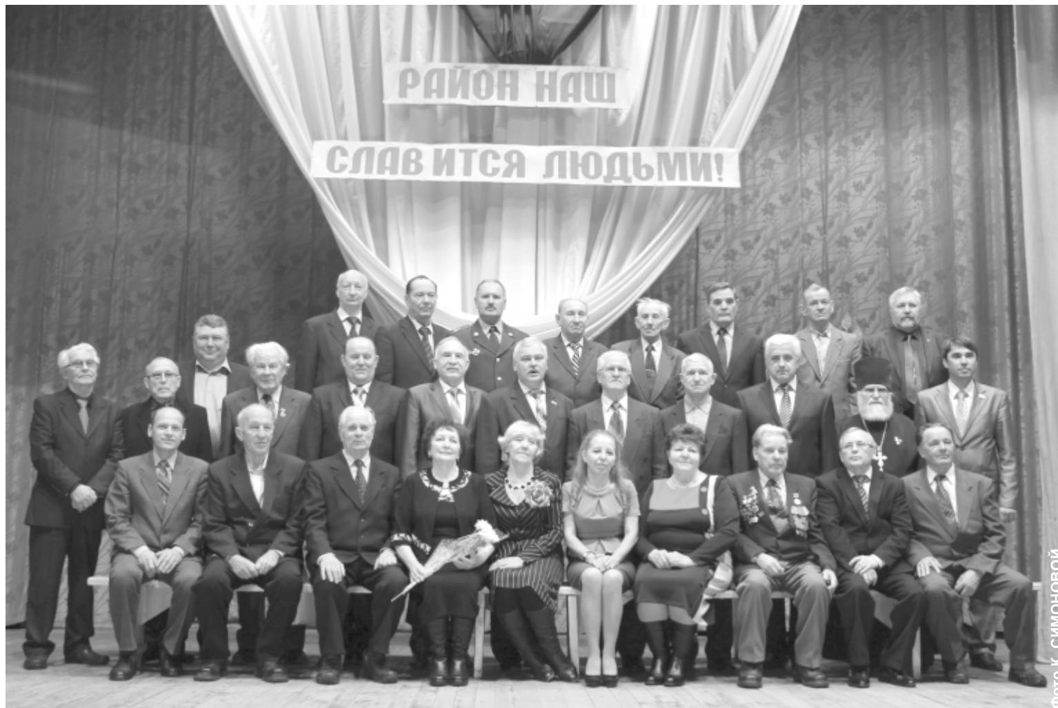
70-летию образования Кетовского района было посвящено торжественное собрание «Район наш славится людьми», где в минувшую пятницу чествовали достойнейших